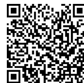
【漢字検定】受検申込フォーム

受検する級の対策テキストを宿題にて進めていきます。合格を目指してしっかりがんばりましょう！