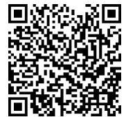
【漢字検定】受検申込フォーム

受検する級の対策テキストを宿題にて進めていきます。合格を目指してしっかりがんばりましょう！